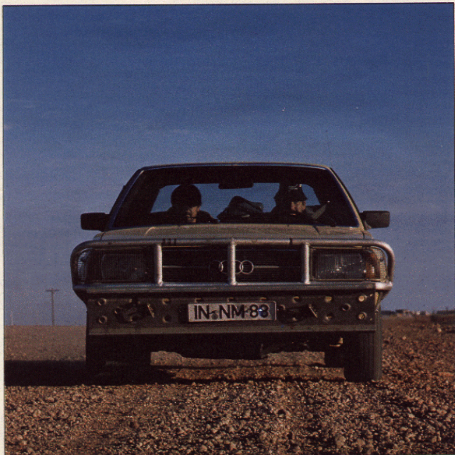
Auf dem „Waschbrett durch die Hölle“ zwischen Alice Springs und Port Augusta in Australien