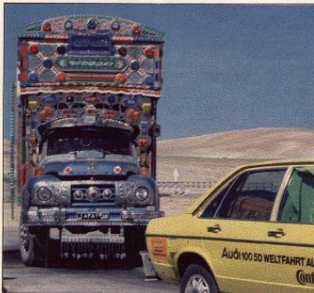
Afghanistan: Lastwagen als rollendes Kunstwerk