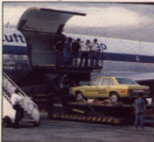
Brasilien: Fährflug nach Afrika