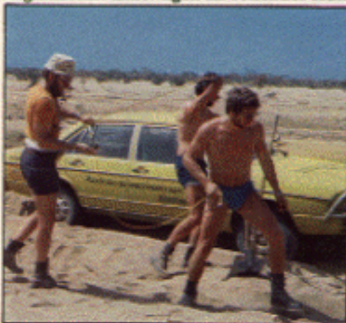
Sahara: Bergungsarbeit im Sand