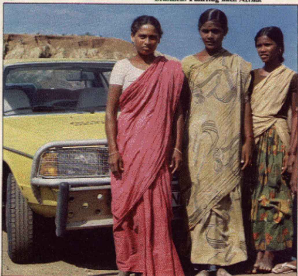
Indien: Gruppenbild mit Damen