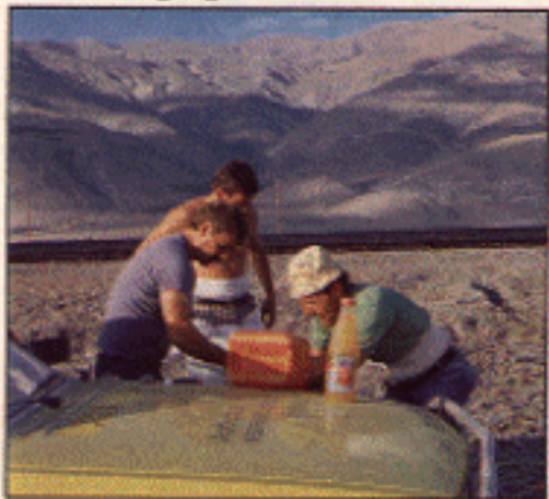
Türkei: die erste Relfenpanne