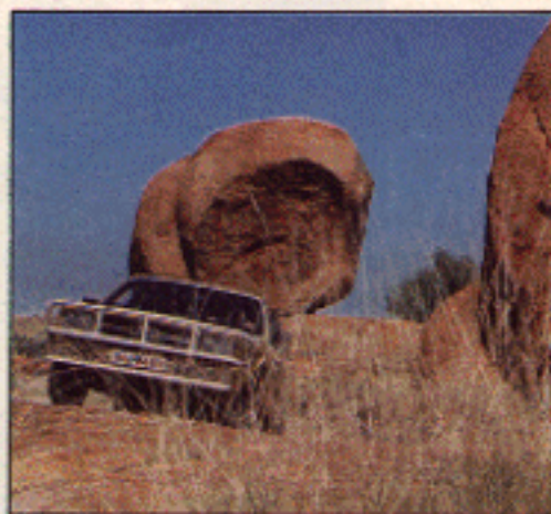
Australien: die „Devil Marbles“