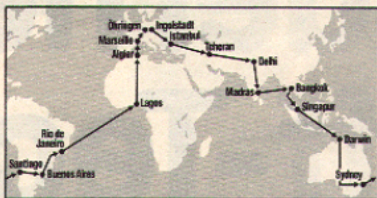
Die Reiseroute von Ingolstadt nach Öhringen

Zusätzlich wurde ein Unterschutz für Motor und Getriebe montiert, der demnächst als Zubehörteil angeboten wird. Sicherheitshalber verlegte die Versuchsabteilung noch die Kraftstoffleitungen durch den Innenraum.